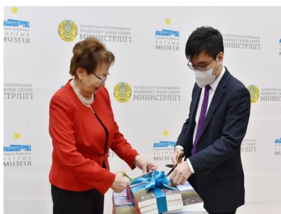
«Катартобе. Некрополь сакской элиты Жетысу» атты ұжымдық монографиясының тұсаукесер рәсімі