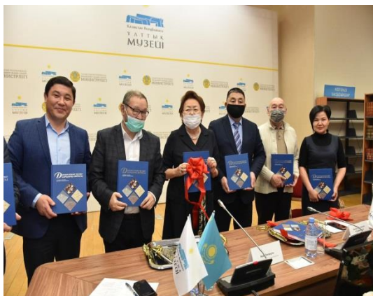
«Далалық Еуразия төсіндегі Сарыарқа мұрасы» атты ұжымдық монографиясының тұсаукесер рәсімі